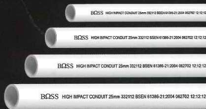
(ยาว 2.90 ม.)